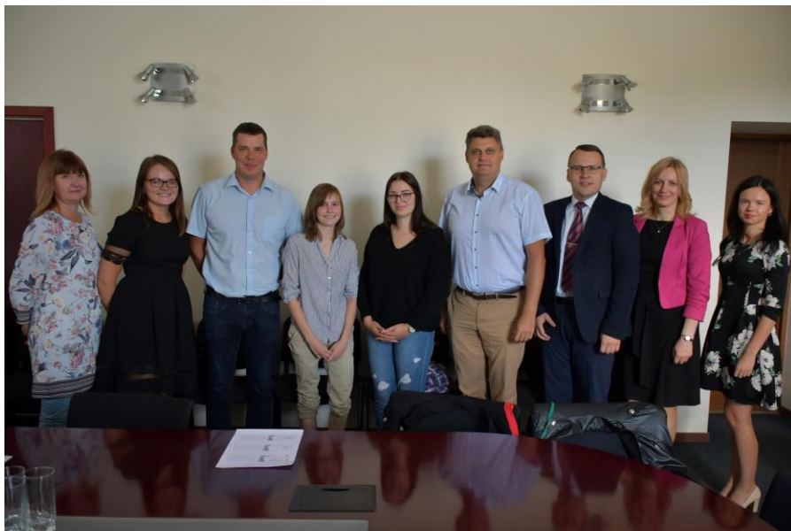
Informāciju sagatavoja: SIA "Jēkabpils pakalpojumi" Sabiedrisko attiecību speciāliste Ieva Gādmāne